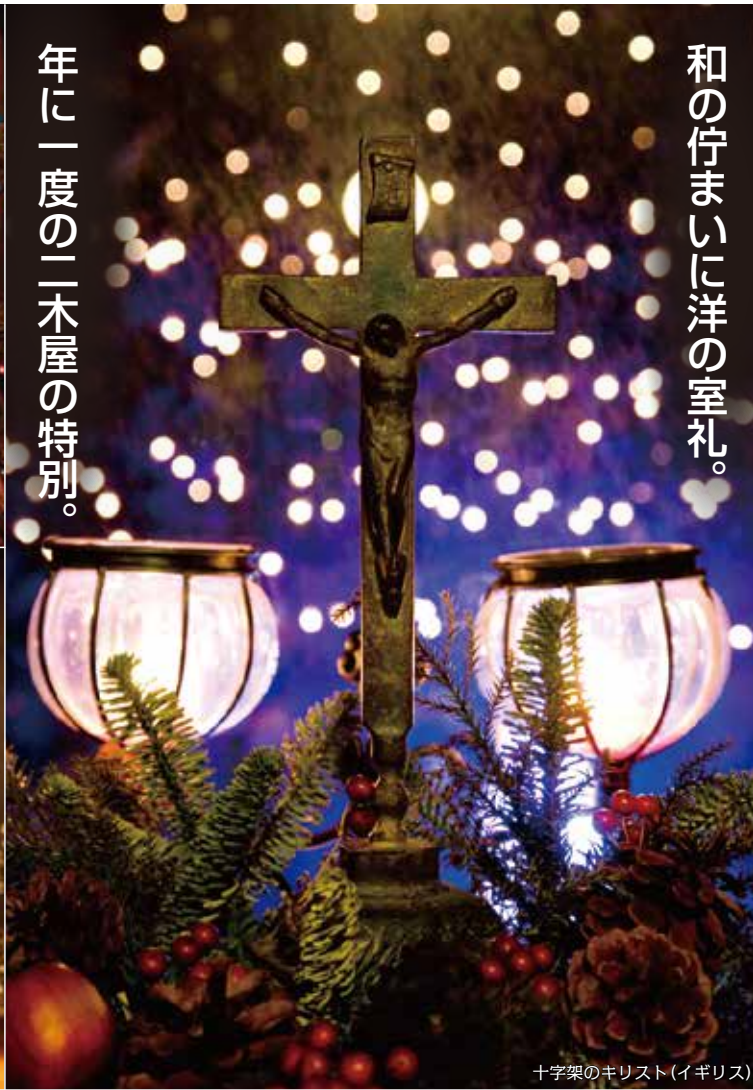
十字架のキリスト(イギリス)