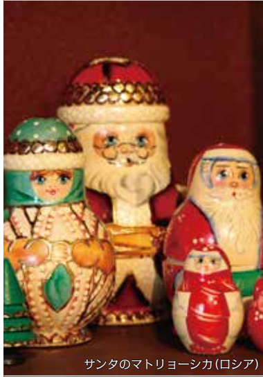
サンタのマトリョーシカ(ロシア)