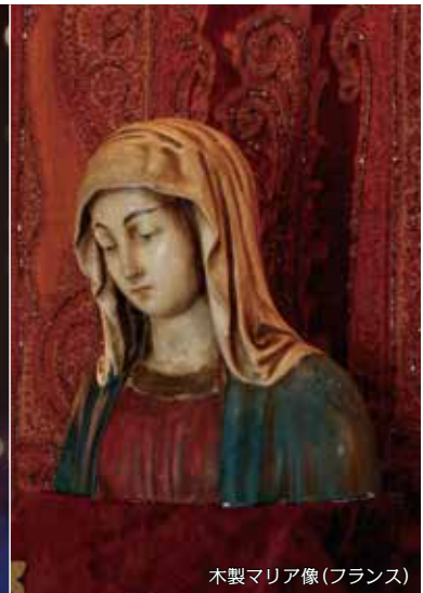
木製マリア像(フランス)