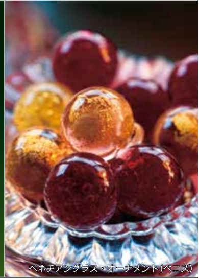
ベネチアングラス・オーナメント(ベニス)

《クリスマス会席&飲み放題プラン》 2016年12月1日(木)~30日(金) 15,000円(税・サ込) 2名様からお申込み。お時間は2時間半。お昼時も受付可。 個室は他に10%の個室料をいただきます。 《クリスマス特別会席&飲み放題プラン》 2016年12月23日(金祝)・24日(土)・25日(日) 12,960円(税・サ込/二木屋華会員様10,800円) 2名様からお申込み。お時間は2時間半。 個室は他に10%の個室料をいただきます。 クリスマスの室礼は、12月初旬より。詳しくは二木屋にお問い合わせ下さい。