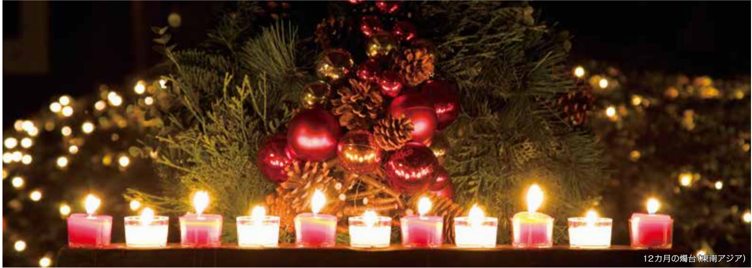
12カ月の燭台(東南アジア)