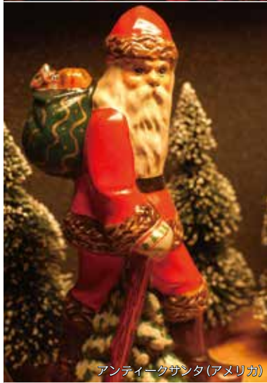
アンティークサンタ(アメリカ)