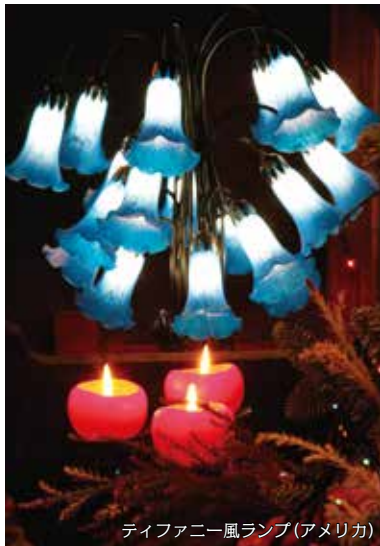
ティファニー風ランプ(アメリカ)