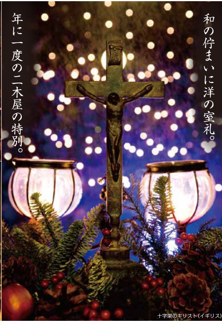
十字架のキリスト(イギリス)