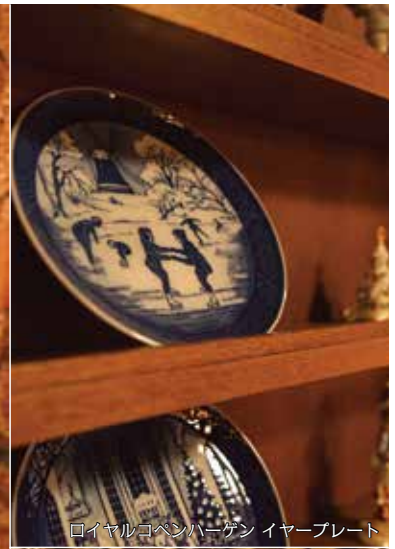
ロイヤルコペンハーゲン イヤープレート