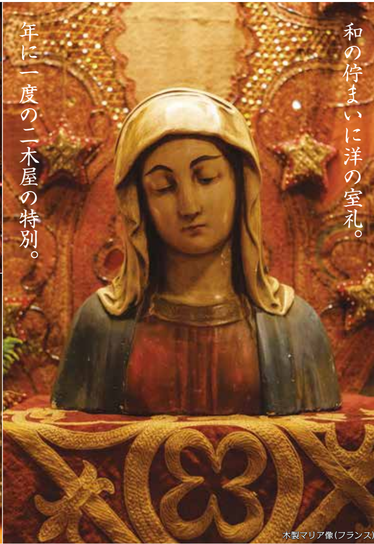
木製マリア像(フランス)