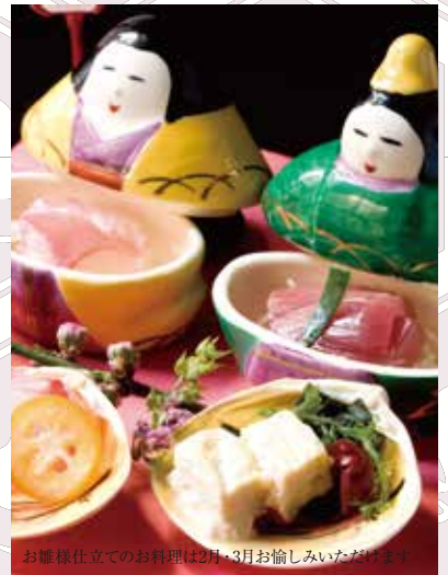
お雛様仕立てのお料理は2月・3月お楽しみいただけます。