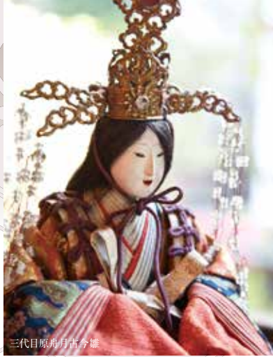
三代目原舟月宮今雛